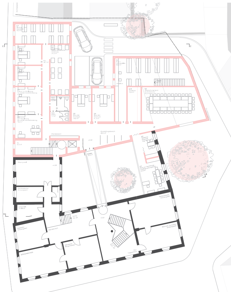
Grundris Obergeschoss M 1:100