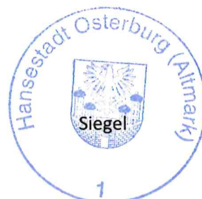
Nico Schulz Bürgermeister

Hansestadt Osterburg (Altmark), den 25.11.2025