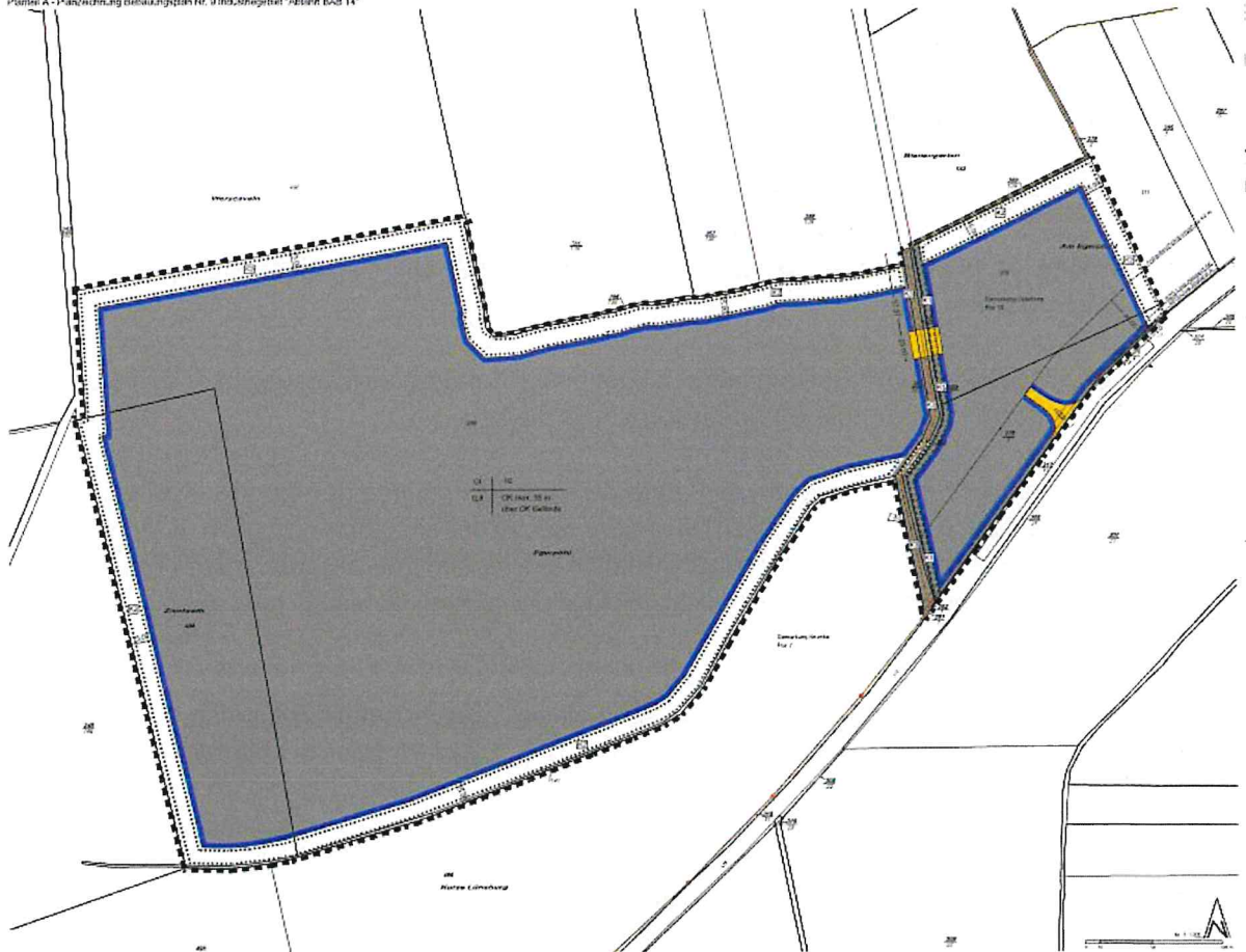
Planausschnitt (nicht maßstäblich)

Planteil A - Planzeichnung Bauungsplan Nr. 9 Industriegebiet "Abfahrt BAB 14"