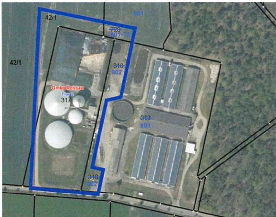
ABBILDUNG 4: LUFTBILD ANLAGENSTANDORT MIT FLURSTÜCKSGRENZEN UND KENNZEICHNUNG DES PLANGEBIETES (MIT AKTUALISIERTEN FLURSTÜCKSNUMMERN)

Das Plangebiet dieses Bebauungsplanes, nordwestlich des Ortsteils Rossau gelegen, und die betreffenden, aktualisierten Flurstücke, können der nachstehenden Abbildung entnommen werden.